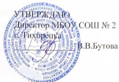
График посещения школьного музея « Козацька горныця» обучающимися в МБОУ СОШ № 2 города Тихорецка.